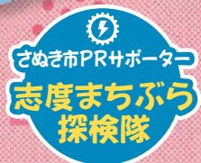
さめぎ市PRサポーター 志度まちぶら 探検隊