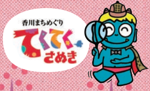
香川まちめぐり てくてく さめぎ